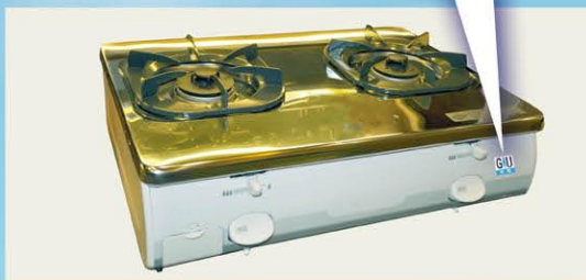
氣體煮食爐 Gas Cooking Appliance