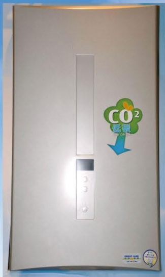
氣體熱水爐 Gas Water Heater