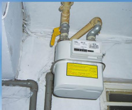
樓宇供氣分喉 Service Riser